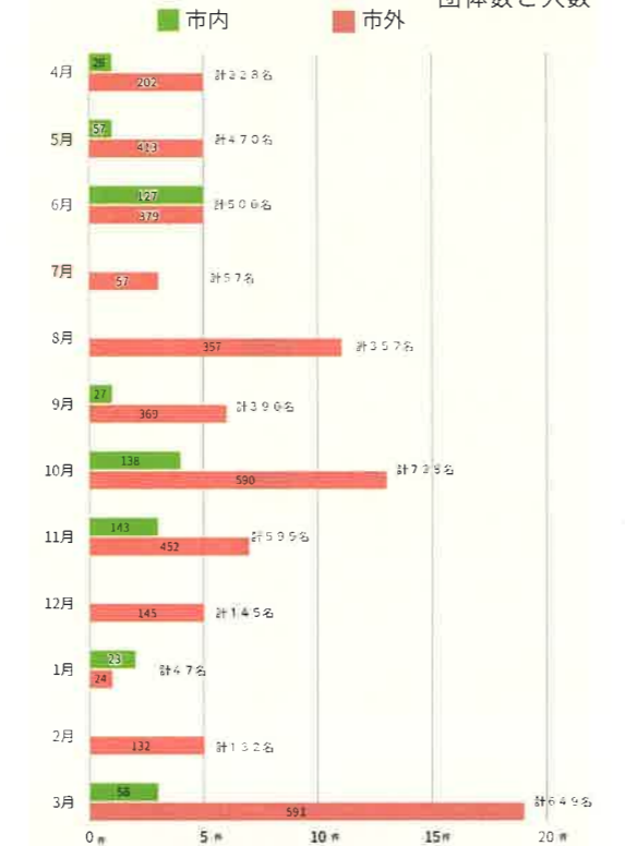
令和4年度 にこにこパーク月別団体利用実績・団体数と人数

令和4年度利用者数 利用者総数 86,159名 市内 31,309名 県内 34,265名 県外 20,585名