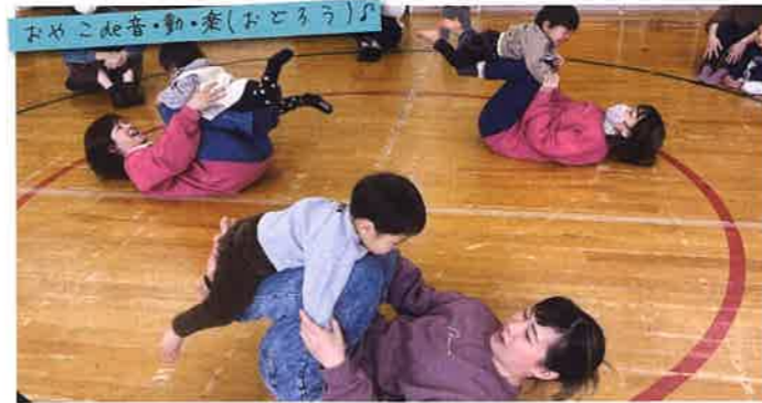
親子でのふれあいあそび、季節の歌や絵本の読み聞かせ、親子で楽しめる簡単な製作をしたり、お家ではできないダイナミックな遊びなど。保育士のかもママスタッフが講師となり毎月開催しています。毎回参加者も多く賑わっています。