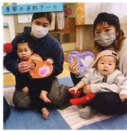
まんまの広場では季節や行事ごとに簡単な製作や手形アートなども行っています!