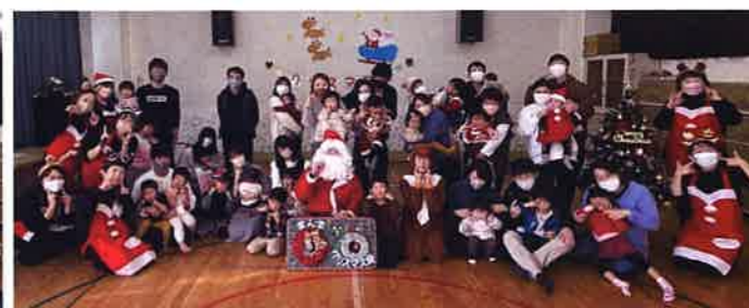
2022年12月11日(日)親子ほっとステーション遊戯室にて、かもママクリスマス会を開催しました。「SPARKLE」による可愛いチアダンス、かもママスタッフによるピアノ演奏やブラックシアター、全員で「赤鼻のトナカイ」を楽しく踊ったあとは、サンタさん&トナカイさんから、ひと足早く子どもたちへのプレゼントもありました。