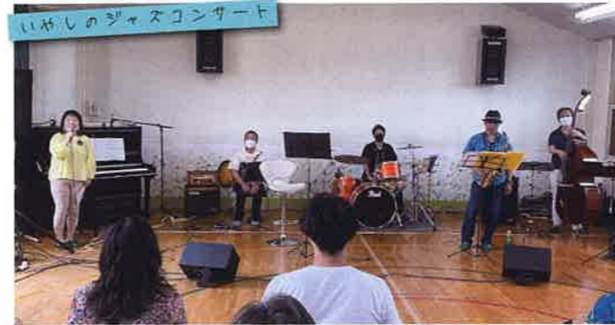
癒しのジャズライブを開催し、ゲストに『Mellow Stones』さんをお招きしました。参加された方からは、「コロナ禍で演奏を生で聴く機会がなかったので、生の演奏を聞けてとても癒されました!」「子どもたちもリズムに乗っていて、親子で楽しめました!」と感想を頂きました。