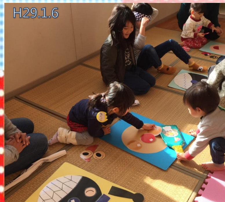
♡学童さんとのお正月遊び♡