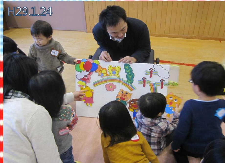
♡ふみやパパの親子遊びの会♡